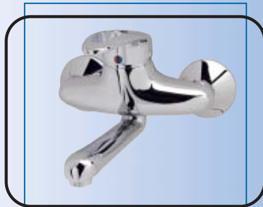
Fali mosdó csaptelep, fém automata leeresztővel B1975AA