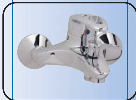
Fali kád/zuhany csaptelep kiegészítők nélkül, automata zuhanyváltóval B1973AA