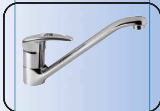
Álló mosogató csaptelep, flexibilis bekötőcsővel B1790AA