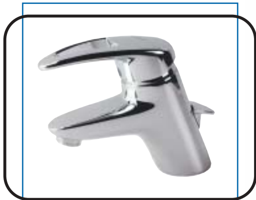
Álló mosdó csaptelep, fém automata leeresztővel, flexibilis bekötőcsővel B1784AA