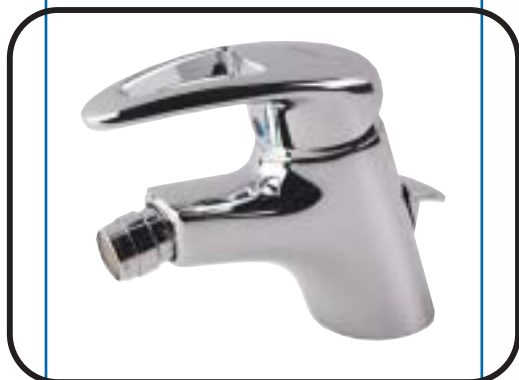
Álló bidet csaptelep, fém automata leeresztővel, flexibilis bekötőcsővel B1789AA