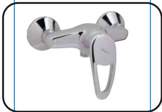
Fali zuhanycsaptelep kiegészítők nélkül B1976AA